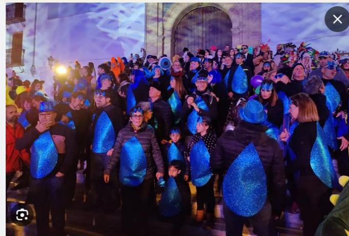
Disfraces por el Agua en Coín | malagaldia