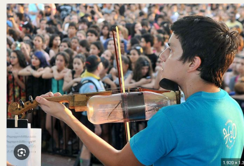
Concienciar sobre el buen uso del agua con música de instrumentos reciclados - EFEverde