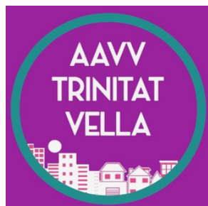
Asociación de Vecinas y vecinos de Trinitat Vella

Han participado vecinas mediadoras comunitarias de la comunidad Pakistani, India y Marroquí del barrio; el Centre Cívic y también las entidades siguientes: