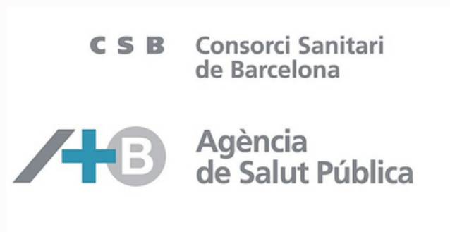
Agència de Salut Pública - Barcelona